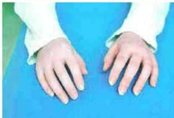
PRED POSEGOM IN PO NJEM – Proteza, izdelana po novi tehnologiji, je zelo podobna zdravi roki.

Na Inštitutu za rehabilitacijo imajo malo manj kot dve desetletji poseben oddelek za silikonsko tehnologijo. Že ime pove, da gre za področje, kjer razvijajo postopke in izdelujejo protetične nadomestke iz silikona. Kot pojasnjuje Tomaž Maver , dipl. inž. ortotike in protetike, je danes na voljo kakovosten, bolj konsistenten in odporen material, zato je silikon še vedno najbolj primeren za izdelavo različnih nadomestkov kot so prsti, roke, ali pa tudi poškodovani deli na obrazu oziroma glavi, na primer uhlji, nos, del čela, okolica očesa ipd. Pri tem pa je poleg kakovostnega osnovnega materiala, za dober estetski učinek, pomemben tudi postopek izdelave.